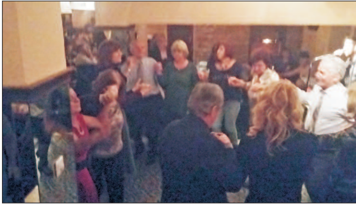
Στιγμιότυπα από τον χορό των συνεστιαζομένων

άρχισε με την ορχήστρα του Κέντρου και στη συνέχεια είχαμε και κλαρίνα για να μην ξεχνιόμαστε, για καμιά ώρα, και συνέχισε ξανά το λαϊκό πρόγραμμα μέχρι το τέλος. Οι λαχνοί μας έγιναν